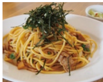
20 Spaghetti with Soy Sauce and Butter Flavor topped with Seaweed