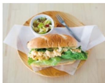
22 Hotdog Bun Sandwich Egg