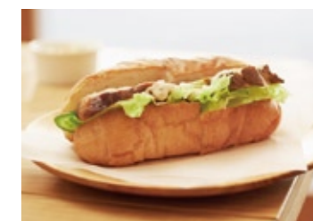
24 Homemade Smoked Chicken