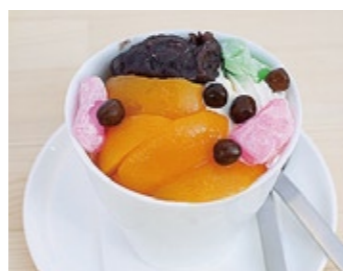
9 Shitamachi Anmitsu Parfait