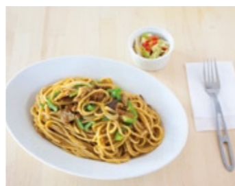
19 Spaghetti with Curry-flavored Sauce