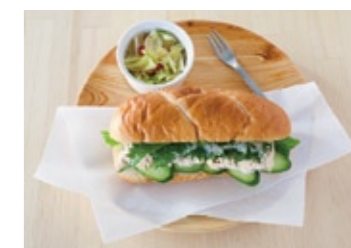
23 Hotdog Bun Sandwich (Egg)