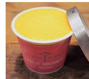
27 Seasonal Fresh Fruit Sherbet