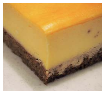
26 Pieno (Cheesecake)