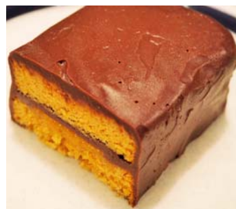
25 Regalo (Chocolate Cake)